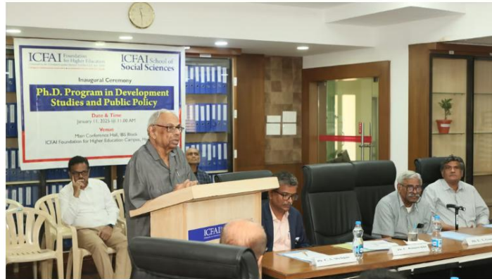
ICFAI launches PhD programme in development studies & public policy