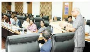
● రిజర్వ్ బ్యాంక్ ఆఫ్ ఇండియా మాజీ గవర్నర్ డాక్టర్ రంగరాజన్