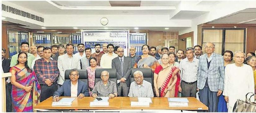
డెవెలప్ మెంట్ స్టడీస్, పబ్లిక్ పాలసీలో పీహెచ్ డీ ప్రోగ్రాంను ప్రారంభించిన ఆర్ బీఐ మాజీ గవర్నర్, ఇక్వాయ్ కులపతి సి.రంగరాజన్

ఆర్ బీఐ మాజీ గవర్నర్, ఇక్వాయ్ కులపతి సి.రంగరాజన్ 'ఐబిఎస్'లో డెవెలప్ మెంట్ స్టడీస్, పబ్లిక్ పాలసీలో పీహెచ్ డీ